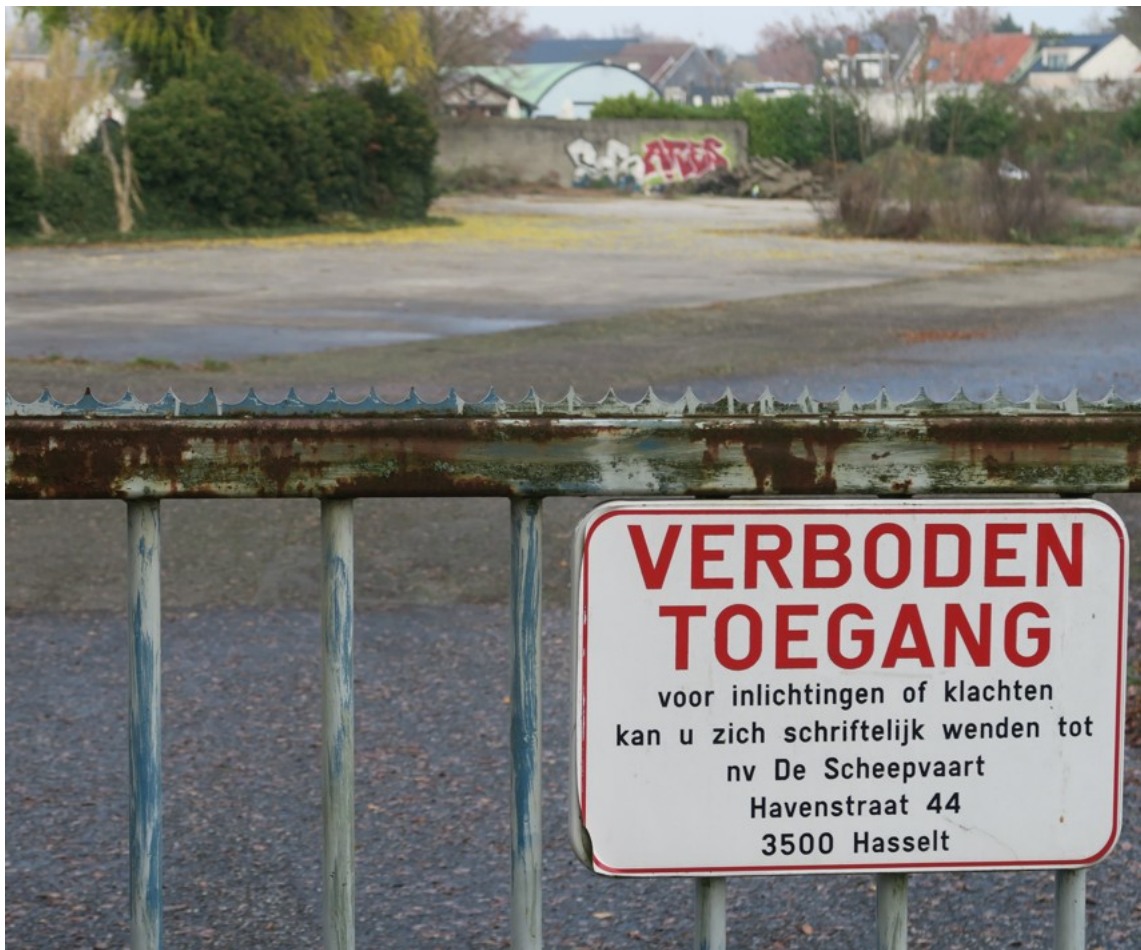
Deze troosteloze plek bij brug 14 omtoveren tot levendig gezellig Havenplein, dat is het einddoel van de denktank die begin volgend jaar aan de slag gaat.

Maar het dossier komt nu opnieuw boven water. Canalis is van het ‘plein’ verdwenen en