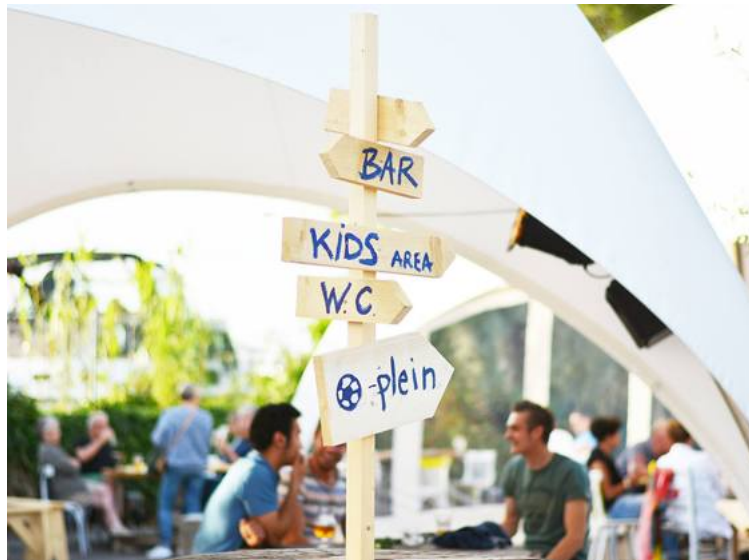
De voorbije jaren werd het terrein alleen aantrekkelijk toen de ter zielen gegane zomerbar Schoten Bad er de tenten opsloeg.

“Meer zelfs”, zegt Björn Dillien, chief technical officer bij Gands. “We geloven dat een dergelijk urbanistisch project alleen kans op slagen heeft wanneer draagkracht ontstaat in de buurt. We vertrekken daarom echt van een wit blad. We hebben zelfs nog geen architect aangesteld. We willen het Havenplein met alle voorzieningen de komende maanden stap voor